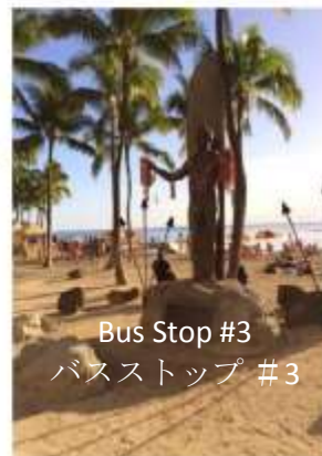
Bus Stop #3