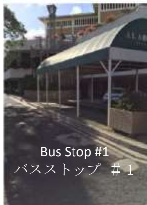
Bus Stop #1